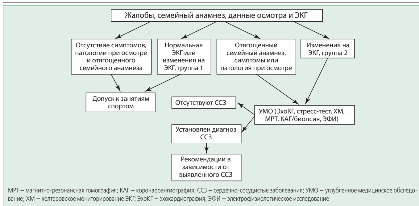
Рисунок 2. Алгоритм предварительного скрининга