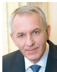
Академик РАН Е.В. Шлякто