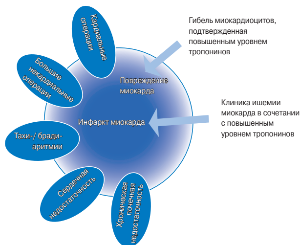
Рис. 1. Рисунок иллюстрирует различные состояния и синдромы, которые могут сопровождаться повреждением миокарда с гибелью его клеток, что подтверждается повышенным уровнем тропонинов. Вне зависимости от этого, при наличии типичной клиники миокардиальной ишемии и закономерной динамики кардиоспецифических ферментов, наиболее вероятен ИМ.

и существующих подходов, и которое включило понятие о том, что очень малый объем миокардиального некроза может быть верифицирован с помощью биохимических маркеров и/или методов визуализации.