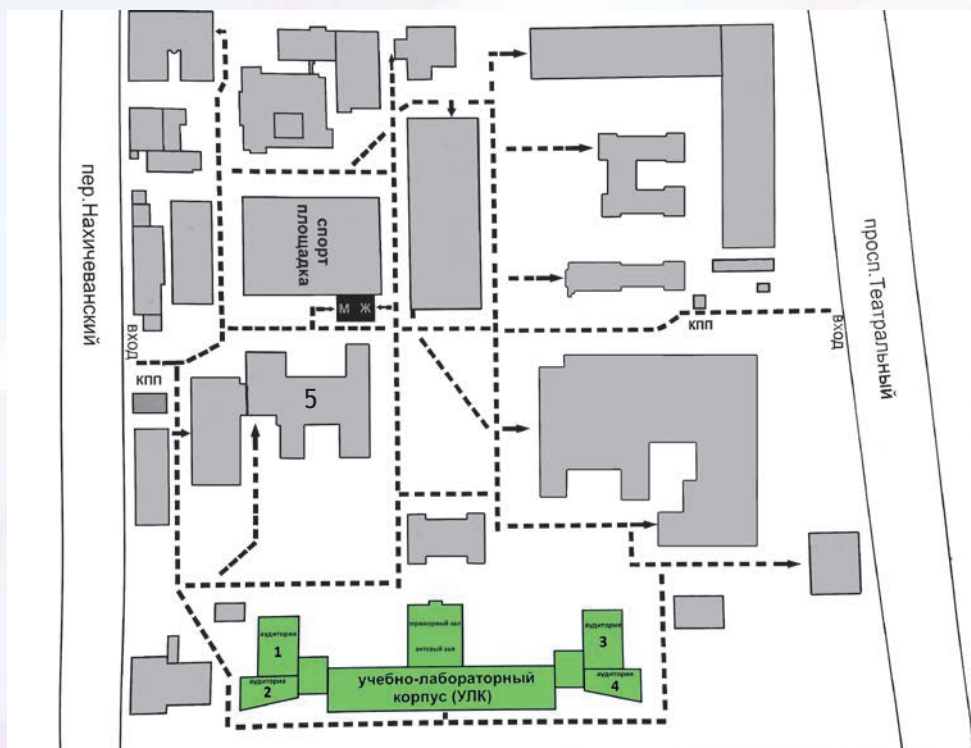
5 — аудитория кафедры Большая терапия